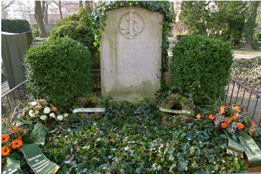
Grabstelle von Georg Ludwig Hartig (1764-1837) auf dem Dorotheenstädtischen Friedhof in Berlin-Mitte.