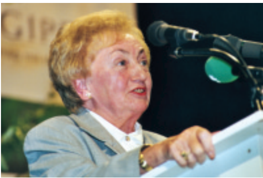
hier steht eine Bildzeile

Allerdings möchte ich nicht falsch verstanden werden: Unser Leitbild ist nicht, um es einmal karikaturhaft auszudrücken, ein Wald quasi als „Sportbegleitgrün“, als Kulisse einer Sportlandschaft. Die Grundfunktionen und die ästhetischen Qualitäten des Waldes dürfen nicht beeinträchtigt werden, sonst fühlen sich auch Erholungssuchende dort nicht mehr wohl.