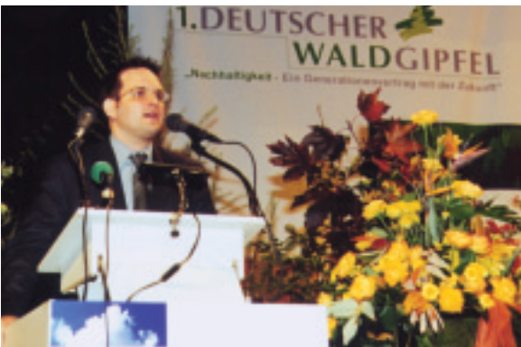
hier steht eine Bildzeile

globalen Maßstab diese Zusammenhänge nicht nur zu thematisieren, sondern auch gemeinsam Strategien zu entwickeln, hier im Sinne der Wälder weltweit entgegenzusteuern.