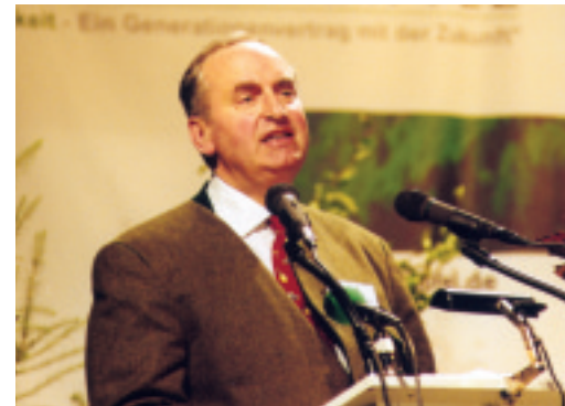
hier steht eine Bildzeile oder auch zwei oder drei

dem Maßstab der Legislaturperioden. Wir selbst oder unsere Familien tragen Verantwortung über Generationen hinweg. Wenn Sie die lange Berufstradition in manchen Försterfamilien anschauen, wird deutlich, dass dies nicht nur für die Waldeigentümer gilt, sondern für den gesamten Berufsstand. So verwundert es nicht, dass gerade in der deutschen Forstwirtschaft die Begriffe „Nachhaltigkeit“ und „naturnahe Pflege“ geboren wurden.