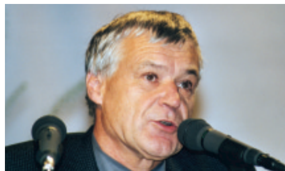
hier steht eine Bildzeile

Der BDF stellt deshalb fest, dass wir mangels ausreichender finanzieller und personeller Mittel nicht mehr in der Lage sind, den nachwachsenden Wald so zu pflegen und in seiner Entwicklung zu lenken, dass er in Zukunft auf allen Gebieten, der Holzproduktion wie der Schutz- und Wohlfahrtsfunktion, auch nur annähernd die heutigen Leistungen der gegenwärtig erwachsenen Wälder erbringen kann. Damit wird das Prinzip der Nachhaltigkeit in unverantwortlicher Weise verletzt. Aufgabe des Ersten Deutschen Waldgipfels muss es sein, das Signal zur Wende zu geben!