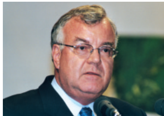
hier steht eine Bildzelle

Holz ist einer der wirksamsten CO 2 -Speicher. Jedes Holzprodukt, sei es ein Möbelstück, ein Holzhaus oder ein Buch, stellt für die Dauer seiner Nutzung eine Vergrößerung des CO 2 -Speichers dar. Mehr Holzverwendung bedeutet daher, den Speicher für Kohlenstoff zu erweitern. Holzverwendung ist somit ein aktiver Beitrag zum Umwelt- und Klimaschutz. Wenn wir gemeinsam die Nutzung von Produkten aus Holz fördern, können wir ökologisch und umweltpolitisch vorteilhafte Wirkungen erzielen. Darauf muss viel stärker hingewiesen werden, denn das unterscheidet uns von Substituten, die aus