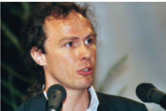
hier steht eine Bildzeile oder auch zwei oder drei

der so genannte Urwaldgipfel, die 6. Vertragsstaatenkonferenz der CBD, statt. Nächste Woche beginnt in Marrakesch die 7. Vertragsstaatenkonferenz der Klimarahmenkonvention. Urwaldschutz kann nicht mehr aufgeschoben werden. Deshalb sollte die Bundesregierung drei Punkte dringend umsetzen und es ist schön zu hören, dass sie das in Den Haag wollen, Herr Staatssekretär: