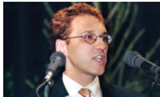
hier steht eine Bildzeile

Wie ich sehe, sind viele Beschäftigte des Waldes heute im Saal anwesend. An dieser Stelle, denke ich, sollten wir uns einmal recht herzlich bei den Beschäftigten des Waldes für ihre geleistete Arbeit bedanken. Wenn wir von einer Existenzkrise der Forstwirtschaft sprechen, so sollten wir auch immer die Beschäftigten des Waldes im Auge behalten. Sie fürchten in vielen Regionen Deutschlands um ihre nackte Existenz. Arbeitsplatzabbau ist das Schlagwort, das bei den Beschäftigten zu Angst und Schrecken führt und das, obwohl immer das Beste für den Wald geleistet wurde und wird. Für die IG BAU ist klar: Die Existenzkrise der Forstwirtschaft ist nicht mit Arbeitsplatzabbau zu meistern. Weit reichende Konzepte mit innovativen Ideen sind gefragt. Es sollte eine Verpflichtung aller Akteure des Waldgipfels sein, an Konzepten zu arbeiten, die den Beschäftigten Sicherheit und Schutz geben, die Motivation erhöht und ein lebenslanges Arbeiten im Wald mit entsprechenden Qualifikationsmöglichkeiten garantiert. Nur so kann eine nachhaltige Forstwirtschaft nach den Kriterien der Agenda 21, zu der wir ja hoffentlich alle stehen, praktisch national umgesetzt werden.